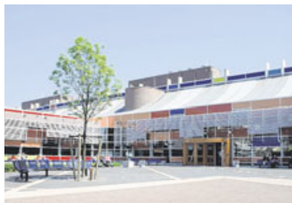
Als moderne Bildungseinrichtungen präsentieren sich niederländische Hochschulen wie die Hogeschool Zeeland (l.) oder die Uni in Utrecht.