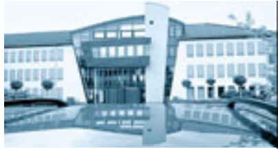
RHEIN-KREIS UND REGION